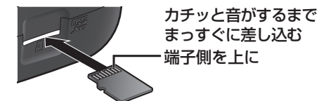
カチッと音がするまで まっすぐに差し込む 端子側を上