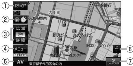
(例) 現在地の地図画面