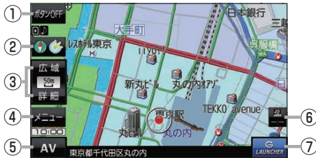
(例) 現在地の地図画面